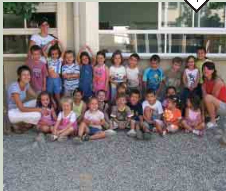
Membres del Casalet (de 3 a 5 anys-mati)