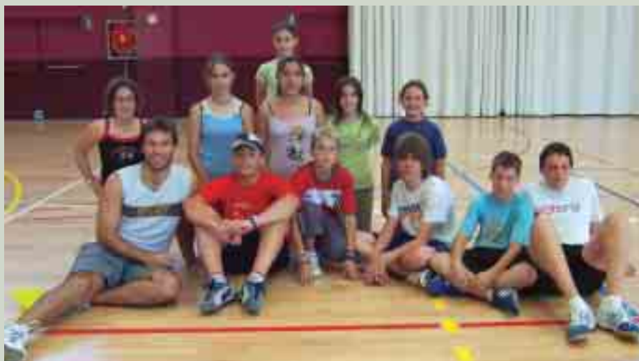
Grup dels grans del Casal Esportiu