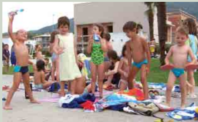
Activitats del Casal d'Estiu (piscina municipal-tarda)