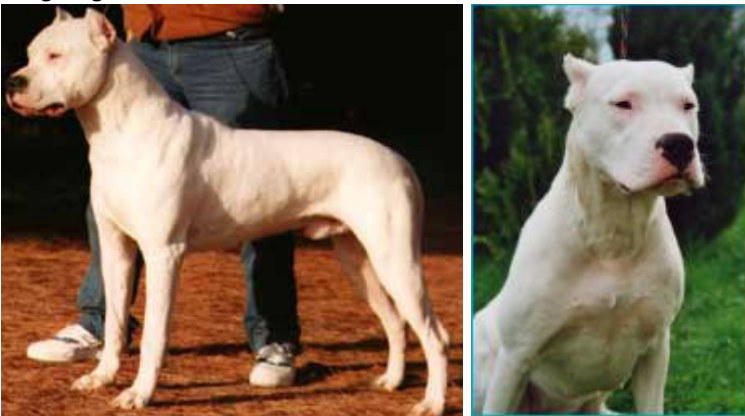
Dog de Bordeus