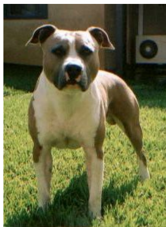
Tosa japonès (o tosa inu)