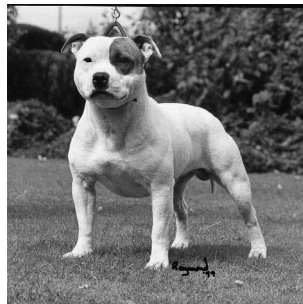
American staffordshire terrier