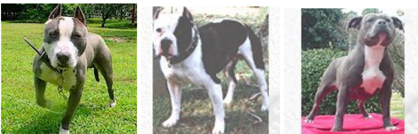
De presa canari